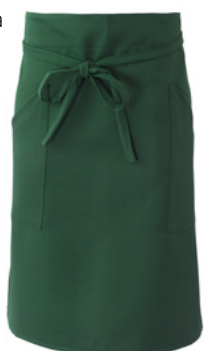
Z49 Verde scuro